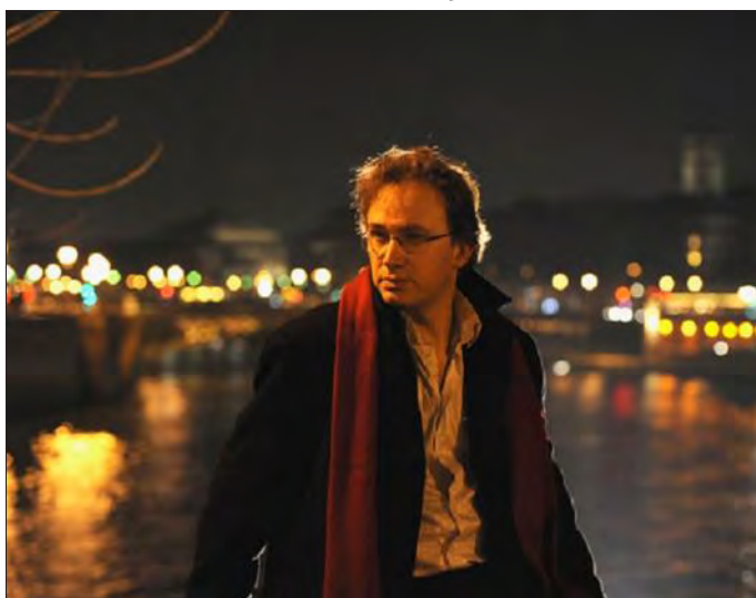
L'organiste Thierry Escaich se produira le dimanche 12 novembre à la collégiale de Thann.

Primé à de multiples reprises, notamment aux Victoires de la musique classique, Thierry Escaich est loin d'être un inconnu sur la scène musicale internationale. On lui doit notamment des œuvres comme La Chaconne pour orchestre, l'oratorio Le Dernier Évangile et un double concerto pour violon et violoncelle, Miroir d'ombres . Ses œuvres pour orgue tiennent une place importante dans son